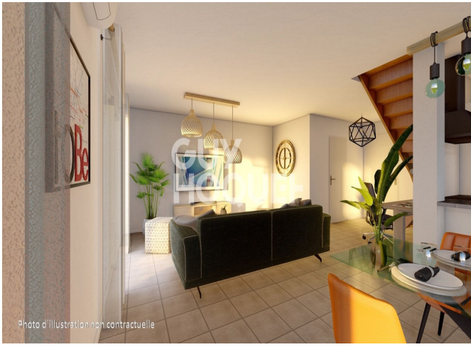
Photo d'illustration non contractuelle